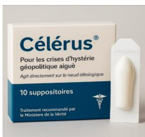
Figure 1 : Parodie pharmaceutique « Célérus® » 18

Par ailleurs, le néologisme Célérus , parodie pharmaceutique virale diffusée sur X/Twitter en octobre 2025, illustre cette évolution critique.